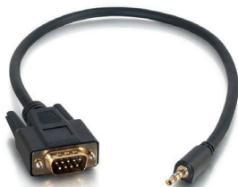
3.5mm zu DB9 Serial Kabel

Bitte überprüfen Sie, ob folgende Teile vorhanden sind: