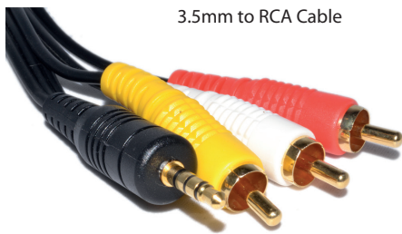
3.5mm to RCA Cable